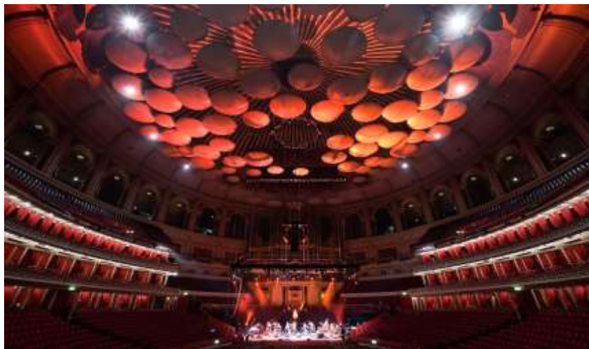
Royal Albert Hall, London