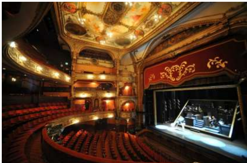
Grand Opera House, Belfast