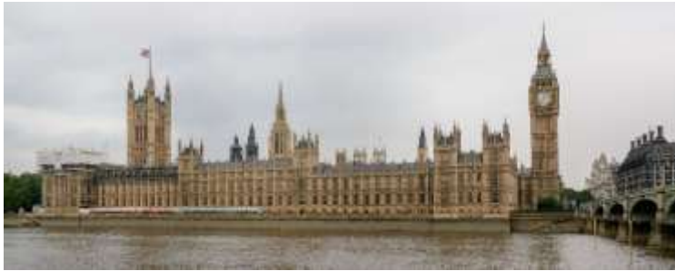
نمای بیرونی دو مجلس پادشاهی متحده