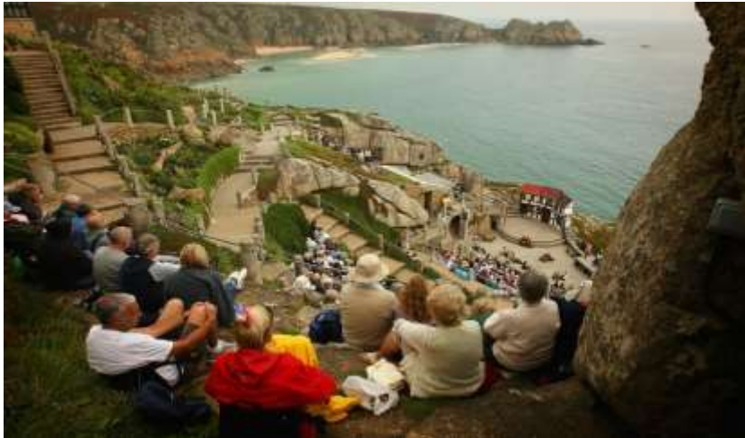
The Minack, Porthcurno, Cornwall

پادشاهی متحده به تحقیق از بهترین سالن های تاتر، کنسرت و اپرا در جهان برخوردار است. از این رو در پی تنها به تعدادی از آنها حسب اهمیت اشاره خواهد شد.