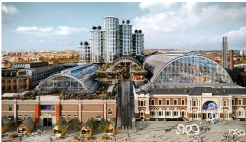
Olympia Exhibition Centre