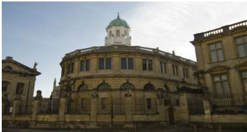
Chelonian Theatre, Oxford