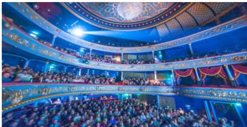
Edinburgh Royal Lyceum Theatre

از سال ۱۶۶۴ تا ۱۶۶۸ از طرحی توسط کریستوفر رن برای دانشگاه آکسفورد ساخته شد. برای کنسرت، سخنرانی و مراسم استفاده می شود، اما به طور غیرمعمول برای یک تئاتر - نه برای نمایش.