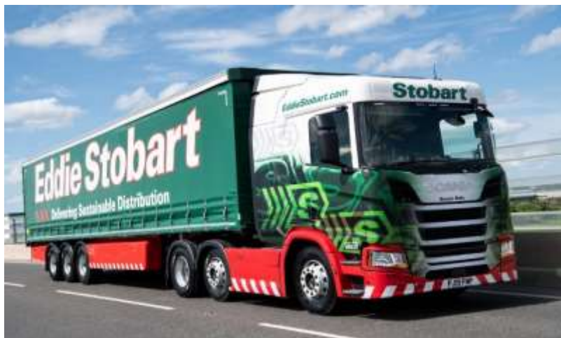
Eddie Stobart CO